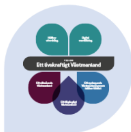
Att utgå från RUS 2030