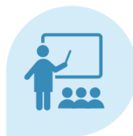
Utbildningar på Tärna

Verksamheten har under året fortsatt arbetet med att konkretisera utvecklingsplanen och kopplat