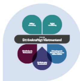
Att utgå från RUS 2030