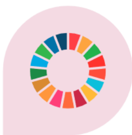
Att utgå från Agenda 2030

Utvecklingsplanens utvecklingsområden är: