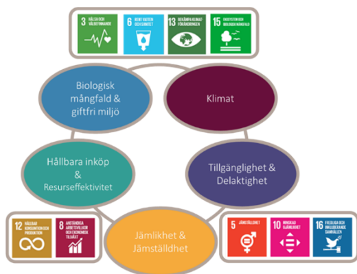
Figur 1. Hållbarhetsprogrammets målområden och deras koppling till regionens prioriterade globala mål inom Agenda 2030.

Region Västmanlands Hållbarhetsprogram 2023–2030 bidrar till målet om Effektiva och ändamålsenliga tjänster av god kvalitet i Regionplan 2024–2026. Denna hållbarhetsredovisning visar resultatet av arbetet 2024. Hållbarhetsprogrammet innehåller fem målområden, se figur 1.