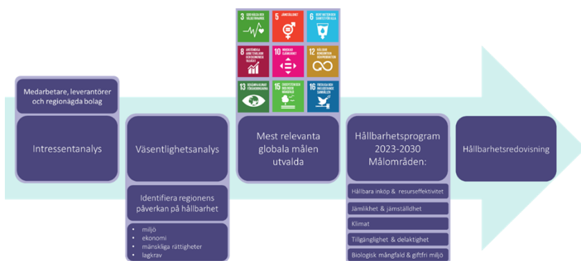
Figur 2: Framtagande och uppföljning av hållbarhetsmål

Målen för regionens hållbarhetsarbete är framtagna utifrån en prioritering gjort med hjälp av en väsentlighetsanalys som därefter ses över årligen. Väsentlighetsanalysen bygger på dialoger med olika intressenter, bland annat medarbetare och leverantörer, där deras förväntningar och krav på regionen undersöks. I väsentlighetsanalysen ingår också en kartläggning av hur regionens verksamheter påverkar och påverkas av olika aspekter inom miljöområdet och inom mänskliga rättigheter. Lagkrav är också en viktig del av underlaget samt utvalet av de 9 mest relevanta globala hållbarhetsmålen i Agenda 2030. De prioriterade hållbarhetsområdena målsattes sedan i programmet. I figur 2 illustreras processen för arbetet med hållbarhetsmålen.