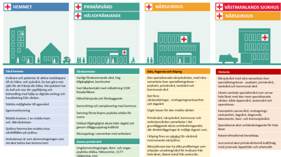
Figur: Hälso- och sjukvården 2029

Utöver de vägledande principerna ger den konkretiserade målbilden för Hälso- och sjukvården 2029 en tydlig vägledning för utvecklingen av hälso- och sjukvården i Västmanland. Att vidta åtgärder för att genomföra HoS2029 är prioriterat.