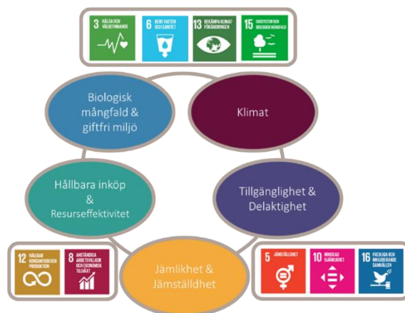
Figur 1. Hållbarhetsprogrammets målområden och deras koppling till regionens prioriterade globala mål inom Agenda 2030.