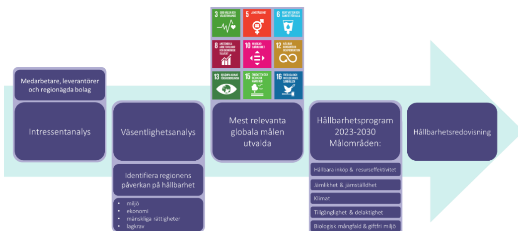
Figur 2: Framtagande och uppföljning av hållbarhetsmål

Resultatet av arbetet med målen i programmet redovisas årligen i en hållbarhetsredovisning som är en del av regionens årsredovisning. I figur 2 illustreras processen för arbetet med hållbarhetsmålen.